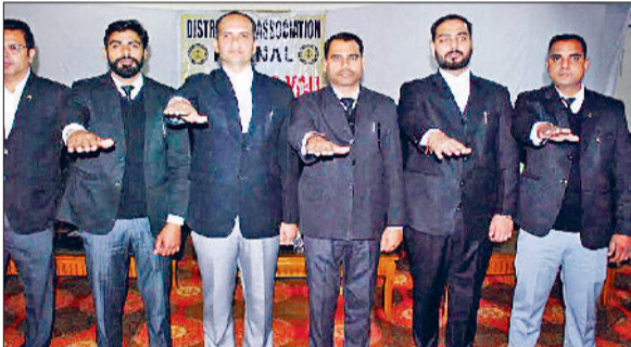
करनाल। शपथ ग्रहण समारोह में जिला बार एसोसिएशन के नवनियुक्त पदाधिकारी शपथ लेते हुए।

जिला बार एसोसिएशन की नई कार्यकारिणी का हुआ शपथ ग्रहण समारोह, ती शपथ