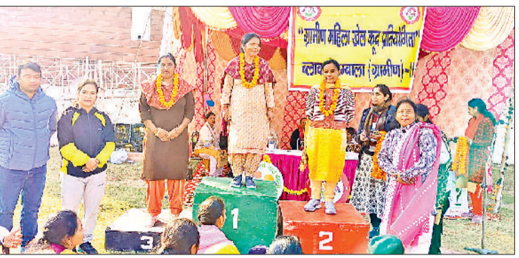
अंबाला