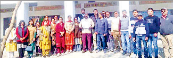
करनाल। पीएम श्री राजकीय वरिष्ठ माध्यमिक विद्यालय कुंजपुरा को जिला मौलिक शिक्षा अधिकारी एवं जिला शिक्षा अधिकारी द्वारा प्रशंसा पत्र देकर सम्मानित करते हुए।

एफएलएन कार्यक्रम को सुचारु रूप से चलाने और गुणवत्ता बनाए रखने के लिए एक नई पहल