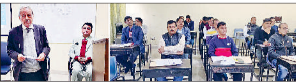
करनाल। तीन दिवसीय प्रशिक्षण शिविर में हिस्सा लेते अधिकारी।

सरकारी कार्यों को सुलभ कैसे बनाएं, तीन दिवसीय प्रशिक्षण शिविर में बताया